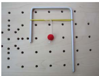
Galgen mit Papierkugel