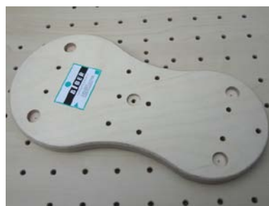
Oder alternativ: Fußrollbrett mit 4 Kugelrollen