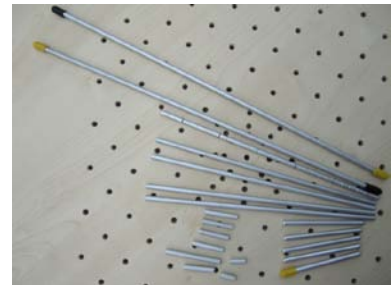
1 Satz Alustifte in 5 Größen, 1 Alustift mit Skalierung