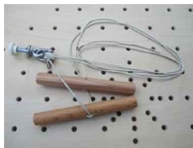
Seilrolle mit 2 Holzhandgriffen