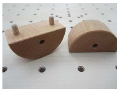
2 Wackelstecker für Rollbretter