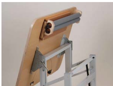
Ablagevorrichtung unterhalb des BIBER-Therapietisches 74/110 für die Basissäulen, Verbindungsträger, Armrollbrett; Montage nur möglich bei BIBER-Therapietisch 74/110, nicht im BASIC-Zubehör enthalten, optional