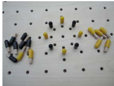
22 Holzdübel mit Kappen in zwei Farben