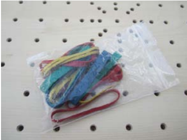
Je 2 Gummiringe in 4 Stärken