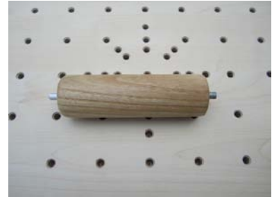
Handgriff, mit Stift und Gewinde