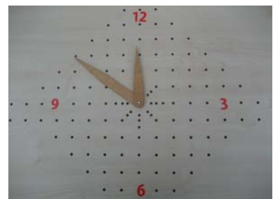
2 Uhrzeiger und Zahlen