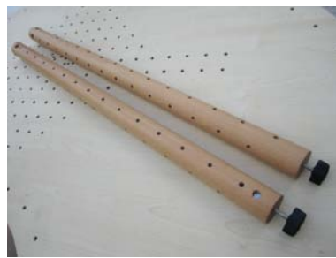
2 Basissäulen aus Holz 80 cm mit Schrauben