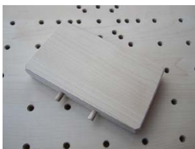
Hochsteller für Armrollbrett