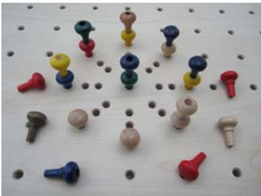
22 Profilstecker farbig