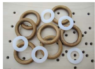
12 Ringe (Holz, Kunststoff)