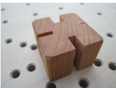
Halterung für vorhandenes Therapiematerial