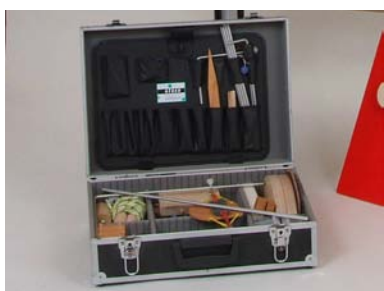
Koffer für folgendes BIBER-Therapiezubehör