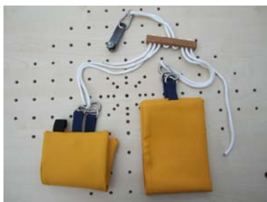
1 Hand-/1 Armschlinge mit Aufhängung, Karabiner und kugelgelagertem Gleiter