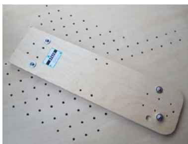
Armrollbrett mit 4 Kugelrollen